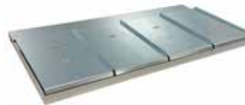
Etagère 4 balances