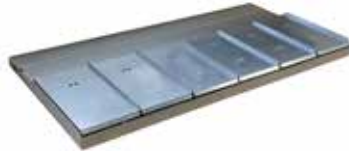
Etagère 6 balances