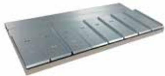
Etagère 8 balances

Nous vous proposons la mise en place de plateaux adaptés à vos besoins et à votre fréquence d'utilisation.